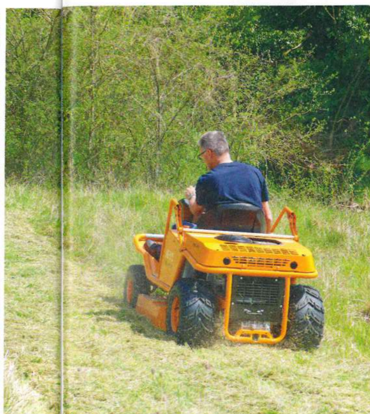
Cette autoportée affiche un rendement maximal de 9 450 m 2 /h.