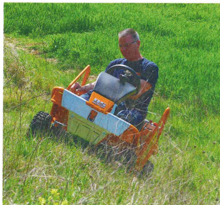
L'autoportée AS 915 Sherpa 2WD se destine aux semi-professionnels ou aux particuliers très exigeants

2- La AS 915 Sherpa 2WD affiche un rayon de braquage constant de seulement 65 cm.