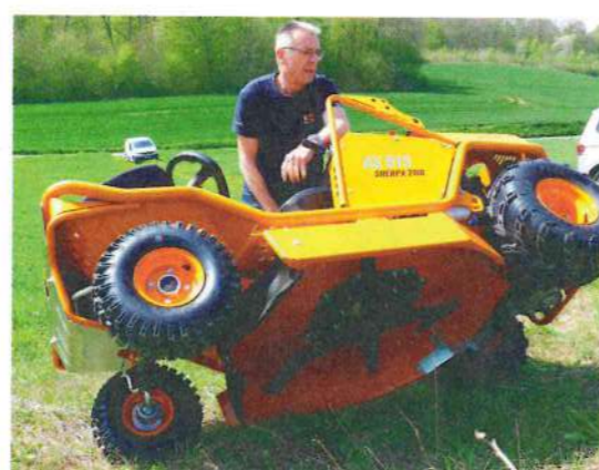
Le centre de gravité bas et le bon équilibrage de l'ensemble facilitent le basculement de cette machine de 365 kg.