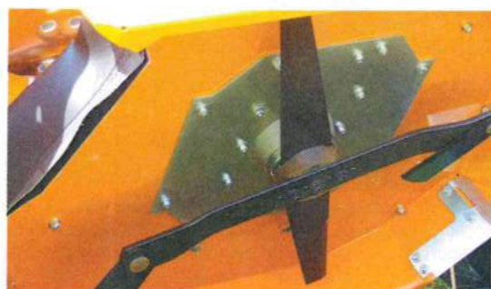
Carter de tonte fermée avec système de lames croisées, dont une à couteaux mobiles.