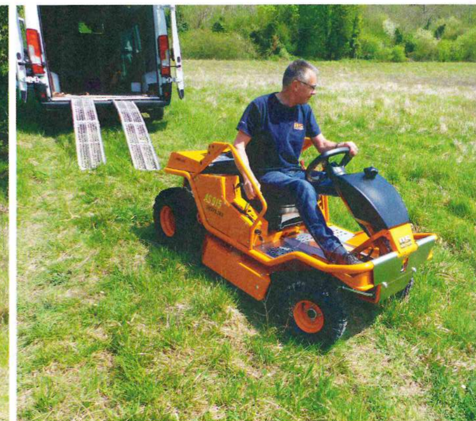
Avec son gabarit compact (191 x 98 cm), elle se transporte facilement dans une camionnette.

À l'image de ses grandes sœurs de la gamme Sherpa, la débroussailleuse autoportée AS 915 Sherpa 2WD du constructeur allemand AS-Motor conserve les qualités intrinsèques de la série : un centre de gravité bas, un empattement large et un châssis compact. Ce qui caractérise donc cette autoportée, c'est tout d'abord sa capacité à tondre et à rabattre dans presque toutes les conditions possibles. La transmission hydrostatique et l'ensemble des commandes accessibles depuis le siège permettent ensuite à son conducteur de se concentrer uniquement sur la conduite et sur la trajectoire à suivre dans les pentes. Pour notre essai, nous avons choisi une colline des environs de Vernon, offrant un terrain en forte pente n'ayant pas été tondu depuis plus de six mois. Et le résultat s'est avéré satisfaisant, la AS 915 Sherpa ayant réussi à graver, de face comme de côté, toutes les parties difficiles qui se présentaient