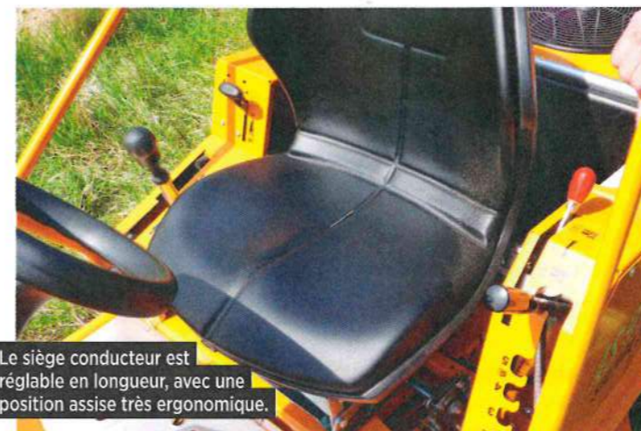
Le siège conducteur est réglable en longueur, avec une position assise très ergonomique.

L'autoportée 915 Sherpa d'AS-Motor est animée par un bicylindre Briggs & Stratton Professional 7220 développant 656 cm 3 de cylindrée pour une puissance maximale de 22 ch. La propulsion hydrostatique autorise un avancement progressif. La conduite à une main, pour sa part, s'effectue en actionnant le levier de conduite – ce dernier intégrant également le frein de stationnement – et en sélectionnant la vitesse d'avancement souhaitée. Pour renforcer la puissance de la